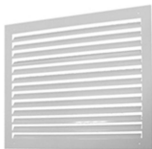
Решетка декоративная DGS для DKS (КДМ-2м)

Решетка декоративная DGS для КДМ применяется в качестве дополнительного аксессуара к клапанам КДМ-2м. Особенности данной решетки являются низкое аэродинамическое сопротивление, улучшенный