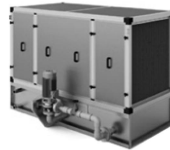
Секция форсуночного орошения

Секции представлены 6 типоразмерами и предназначены для адиабатического увлажнения воздуха. Высокая эффективность (КПД до 95%) обеспечивается встречным распылением воды двумя рядами форсунок (один ряд по потоку воздуха, второй ряд - против потока воздуха). Во время работы секции происходит