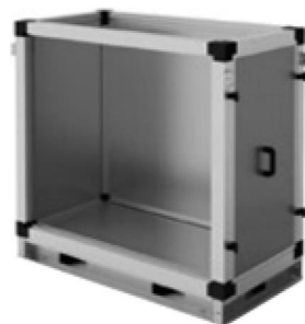
Секция забора воздуха сверху (выхлопа вверх)

Секции представлены восемью типоразмерами. Секция Z2 доукомплектовывается верхней торцевой панелью: для забора воздуха - с заслонкой и мягкой вставкой, для выхлопа воздуха - мягкой вставкой. Размещение заслонки на торцевой панели возможно только с наружной стороны кондиционера.