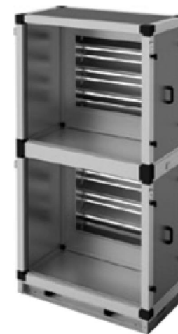
Секция перекрывающая (с 2 заслонками)

Секции предназначены для разделения и перекрытия воздушных каналов основного и резервного вентилятора. Секция S3 предназначена для установки на стороне входа вентиляторов. Секция S4 предна-