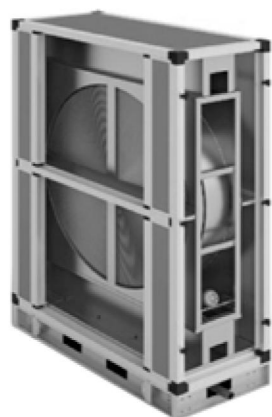
Секция роторного регенератора

Секции представлены шестью типоразмерами. Нагрев холодного приточного воздуха осуществляется за счёт аккумуляции теплоты вытяжного воздуха на поверхности теплообмена с последующей ее отдачей. Поверхность теплообмена образована вращающимся барабаном из волнообразных алюминиевых лент. В роторных регенераторах возможен небольшой переток между потоками воздуха. Щёточное уплотнение, размещённое по ободу ротора и на линии раздела, снижает переток воздуха. Все секции стандартно оснащены поддоном с патрубком для отвода