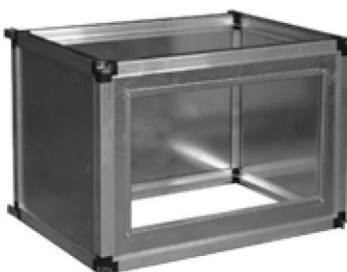
Секция SB (подмес сбоку)