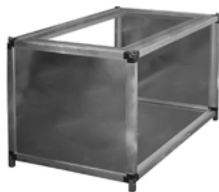
Секция SV1 (подмес сверху)