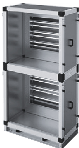
Секция перекрывающая (с двумя заслонками)